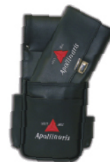
Kellnerbörse und -halftasche